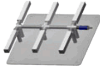
Stone Diffuser Manifold