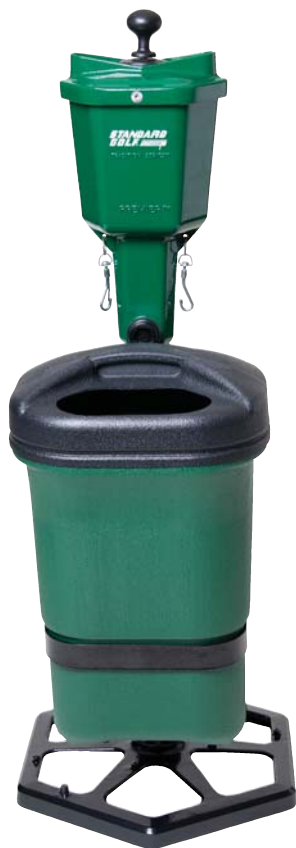
CON LAVABOLAS PREMIER CON LAVABOLAS MEDALIST