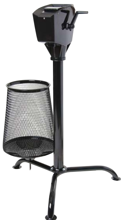
CON LAVABOLAS CLASSIC