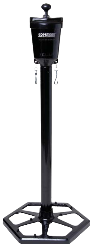
CON LAVABOLAS PREMIER CON LAVABOLAS MEDALIST