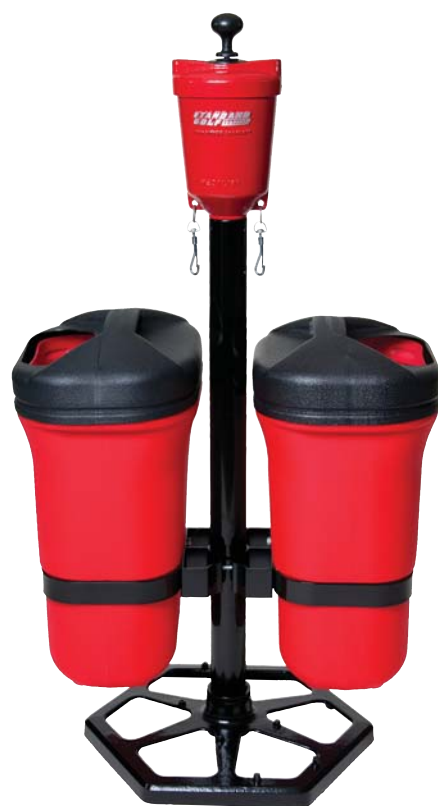
CON LAVABOLAS PREMIER CON LAVABOLAS MEDALIST