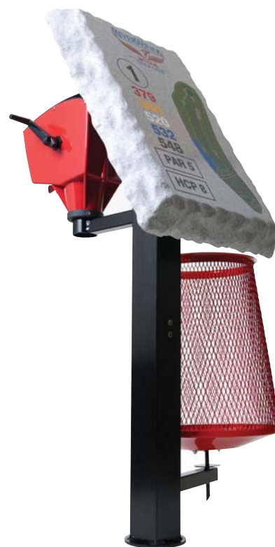
CON LAVABOLAS CLASSIC