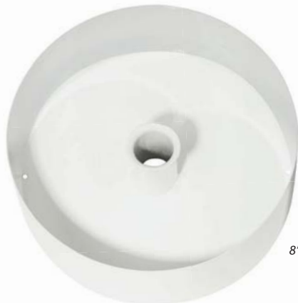
8" (20,3 cm) Copa

4" (10 cm) de alto 4 1/4" (10,8 cm) de diámetro 18150 Copa de aluminio para green de prácticas